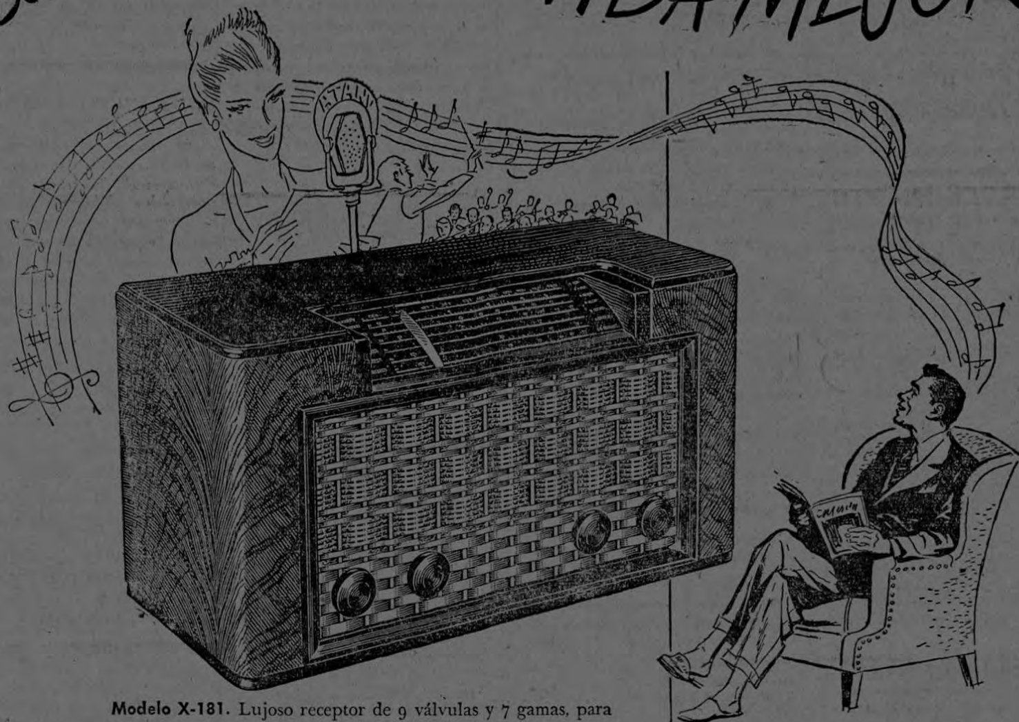
Modelo X-181. Lujoso receptor de 9 válvulas y 7 gamas, para corriente alterna, provisto de indicador de sintonía por rayos catódicos y altavoz de 20 cm, con imán de alnico 5 G. E.

Deje que su oído disfrute . . . Un mundo lleno de sorpresas y emociones se halla al alcance de su mano . . . Programas de música clásica o de aires populares, charlas instructivas, cotizaciones de los mercados y bolsas mundiales, noticias de los últimos acontecimientos internacionales, llegarán a su oído con asombroso realismo y pureza tonal, gracias a los nuevos receptores General Electric, contruidos a prueba del clima tropical para asegurarle largos años de servicio seguro en el ambiente más desfavorable . . .