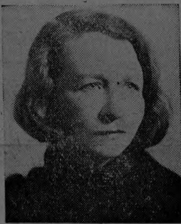
EDNA ST. Vicent Millay Famosa Poetisa Norteamericana

Un famoso crítico ha dicho que de la Antología publicada por la Sociedad de Poetas de América solamente un poema